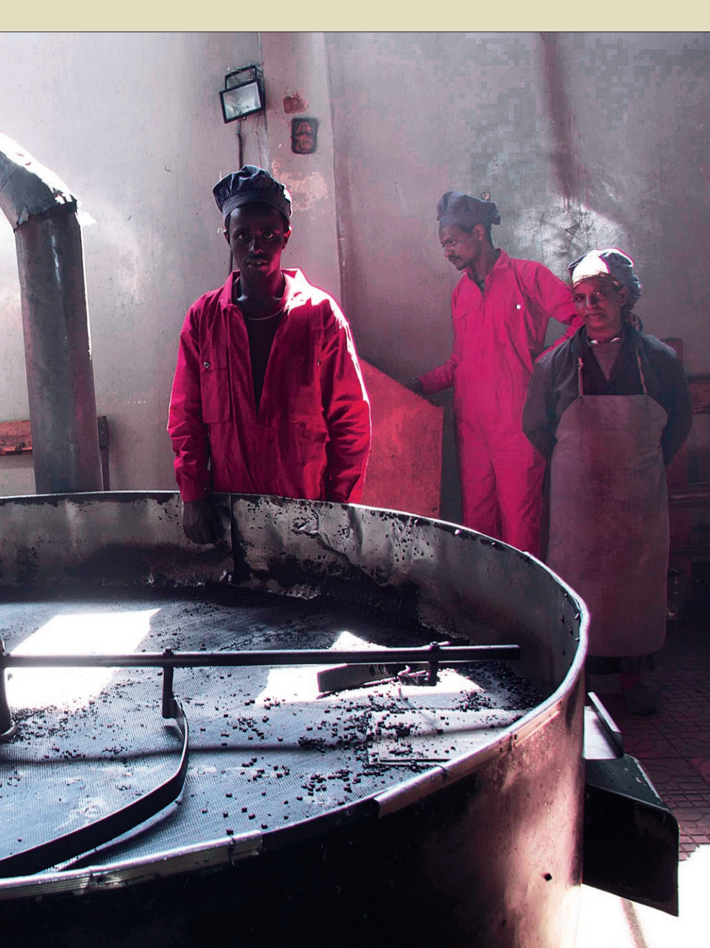
kaffe blir brent før eksport til Europa.